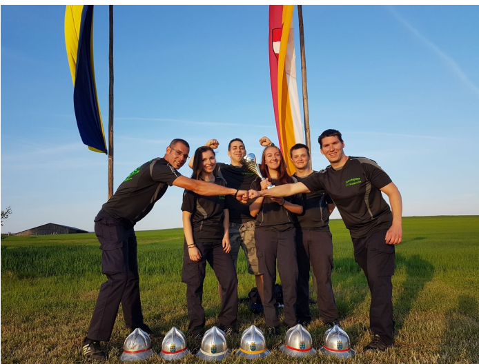
Wettkampfgruppe 1 in Nonndorf