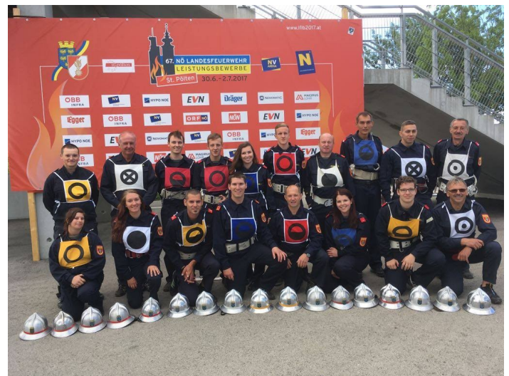
Beide Gruppen nach dem Wettkampf am Landesfeuerwehrleistungsbewerb in St. Pölten