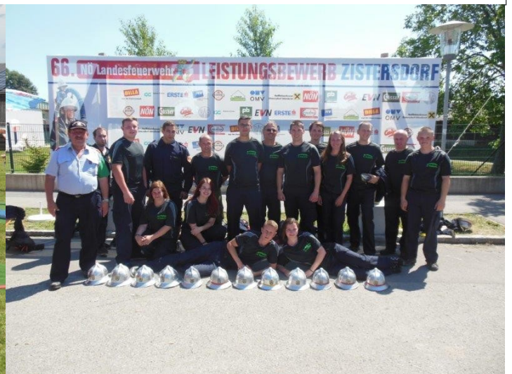
Nach dem „erfolgreichen Wettkampf“ in Zistersdorf