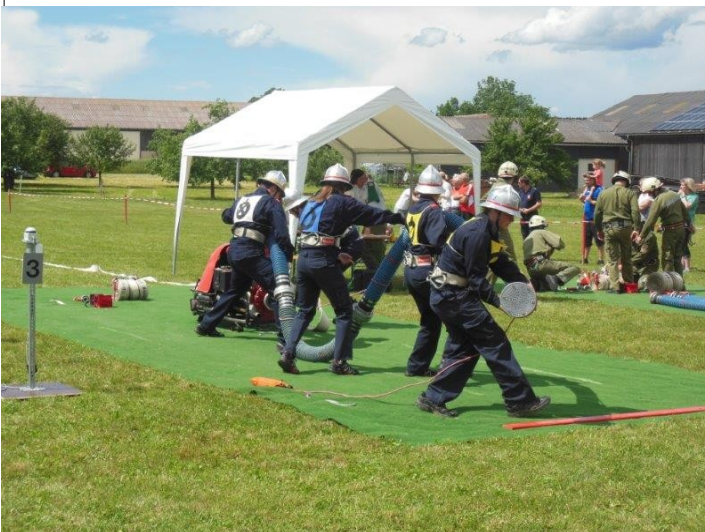
Unsere Wettkampfgruppe in Rappolz beim Bewerb